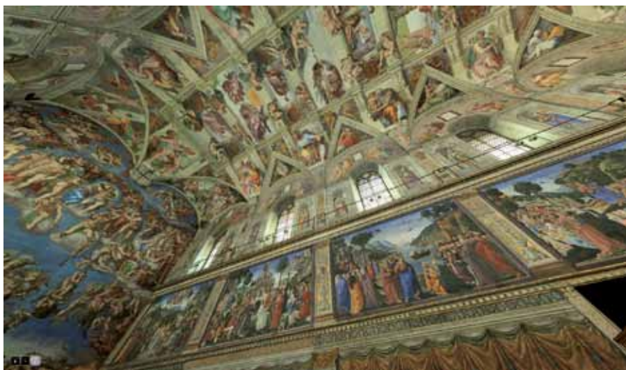
Capture d'écran du site du Vatican.

Autre réalisation de qualité qui ne manquera pas de fasciner les élèves: la chapelle Sixtine en 3D sur le site du Vatican 14 lui-même. Les images sont vertigineuses.