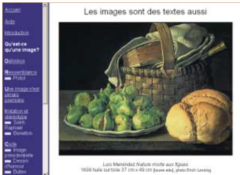
Page d'accueil du dossier « Les images sont des textes aussi », sur le site de lettres de l'académie d'Orléans-Tours.

– proposer des activités multiples : analyses de textes variés (littéraires ou non – prose, poésie, inscription), d'images (bas-reliefs du monument, plans...), questionnaires interactifs récapitulant les connaissances (mis en pages avec le logiciel Hot Potatoes). À partir des ressources documentaires et de ces activités, l'enseignant est invité à construire un parcours adapté à sa classe et à ses objectifs pédagogiques ;