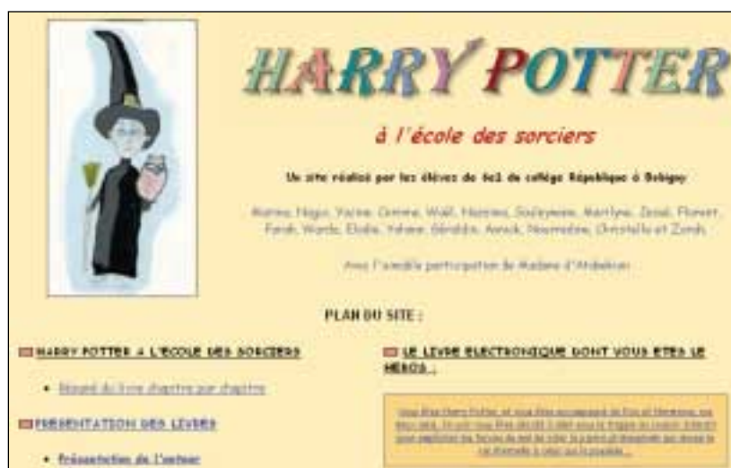
Le site consacré à Harry Potter, réalisé par les élèves de 6 e : www.ac-creteil.fr/lettres/eleves/harry

Nous avons commencé par les résumés, qui permettaient de se représenter l'architecture générale du roman. Chaque élève a dû relire un chapitre, et, en prévision des activités à venir, prendre des notes sur les personnages, les mots inventés, et tout ce sur quoi nous nous apprê-