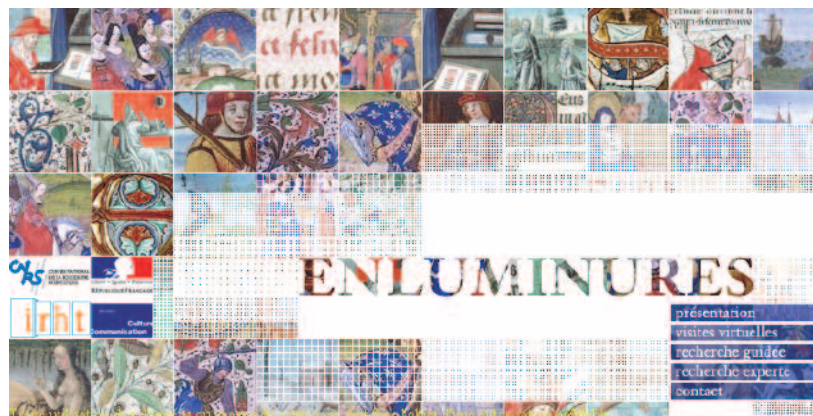
L'une des bases de données iconographiques du ministère de la Culture : enluminures et éléments de décor des manuscrits médiévaux conservés dans les bibliothèques municipales françaises, 80 000 images en ligne.