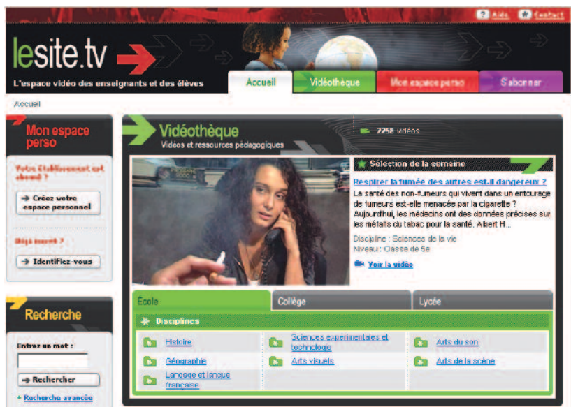
Lesite.tv de France 5, coédité avec le CNDP.

dizaine sont consacrées aux images d'art ou du patrimoine, et parmi elles : la base Joconde, catalogue des musées de France ; la base Enluminures (reproductions numériques de manuscrits médiévaux) ; la base MNR (musées nationaux récupération : 2 000 œuvres d'art récupérées en Allemagne après la Seconde Guerre mondiale) et la base Réunion des musées nationaux (200 000 photographies d'œuvres d'art conservées dans les musées français).