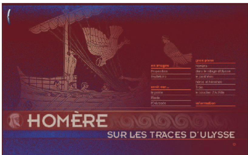
« Homère, sur les traces d'Ulysse », une exposition virtuelle de la Bibliothèque nationale de France.

L'usage le plus courant est la navigation sur Internet : recherche documentaire, travail guidé sur un site, constitution d'un dossier sont autant d'activités lors desquelles les élèves accèdent à des sites potentiellement très variés qui peuvent être des sources d'information ou des supports pour un travail de commentaire écrit ou oral. Comme dans le cas des enseignants, les sites susceptibles d'être exploités sont innombrables : sites de presse en ligne, blogs, encyclopédies, sites d'institutions (bibliothèques, musées), banques textuelles ou iconographiques... (toutes celles citées plus haut – lesite.tv, Jalons pour l'histoire du temps présent, Louvre.edu, etc. – sont évidemment d'abord faites pour les élèves). L'un des sites pédagogiques les plus appréciés pour la navigation avec les élèves en cours de français est sans doute celui de la Bibliothèque nationale de France, avec ses dossiers pédagogiques et ses expositions virtuelles 20 . Texteimage 21 est lui aussi un très beau site, d'accès payant, édité par Cadmos, qui permet d'aborder des textes fondateurs