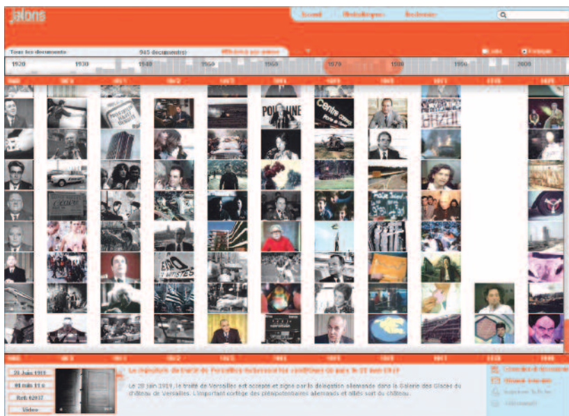
Jalons pour l'histoire du temps présent, de l'INA.